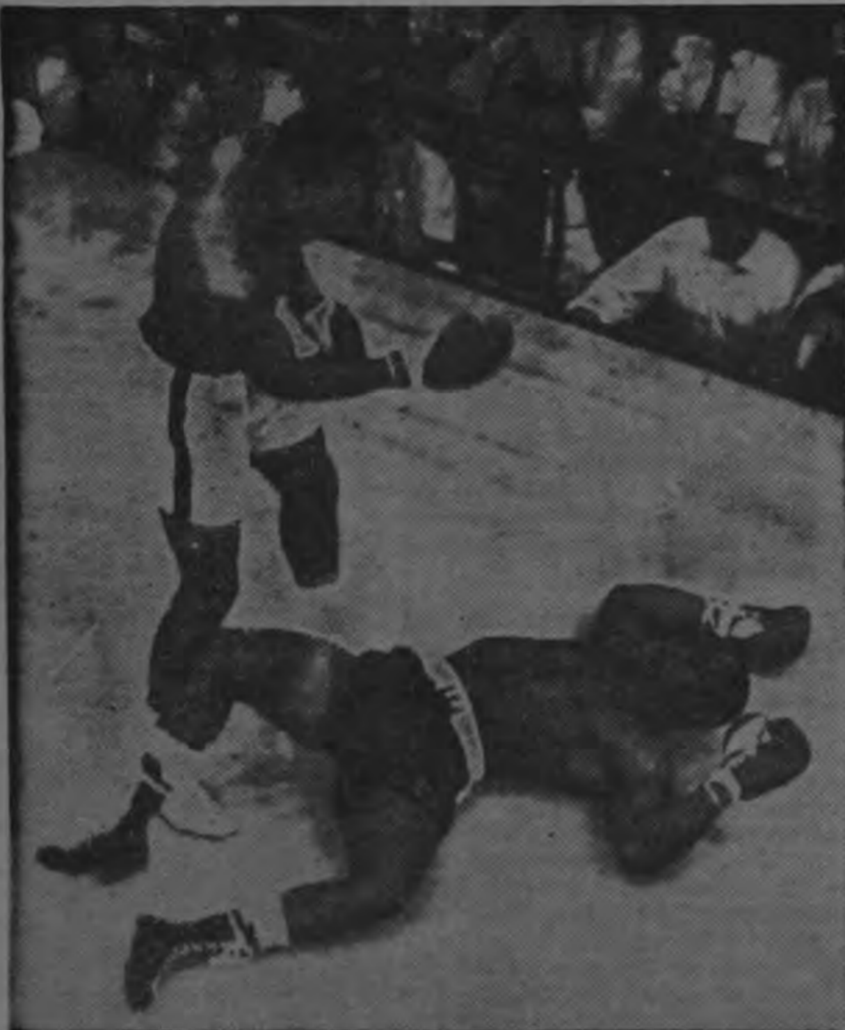
NUEVA YORK —AP— Aquí vemos a Cassius Clay — ahora Muhammad Ali— cuando envió a la lona a Charles "Sonny" Liston, en Lewiston, Maine, el 25 de mayo de 1965. Fue un match revancha en el cual Liston falló en su tentativa de recobrar el título mundial en los pesados. 1971.

Se jugó por segunda vez y tuvo más éxito que en la primera ya que mucho de los equipos visitantes trabajaron muy bien en pareja brindándose al público excelentes encuentros. De nuevo el gran jugador de Rhodesia se convirtió en la estrella del torneo al hacer pareja con Sherry Towers y coronarse Campeones después de haber tenido en los norteamericanos MacClafin y Van Dillen sus principales enemigos. El juego final se recuerda por su larga duración ya que terminó pasada la medianoche sin que los espectadores abandonaran sus asientos. El primer set fue ganado por la pareja de los Estados Unidos 10-12; el segundo set fue de Pattison y Towers por 6-3; en el tercero ganaron de nuevo por 3-6 los norteamericanos colocándose en ventaja, pero en el cuarto de nuevo empataron los rodesianos con marcador de 6-3 y en el quinto y último set Pattison y Towers triunfaron llevándose el juego por 6-2, y total de 3-2.