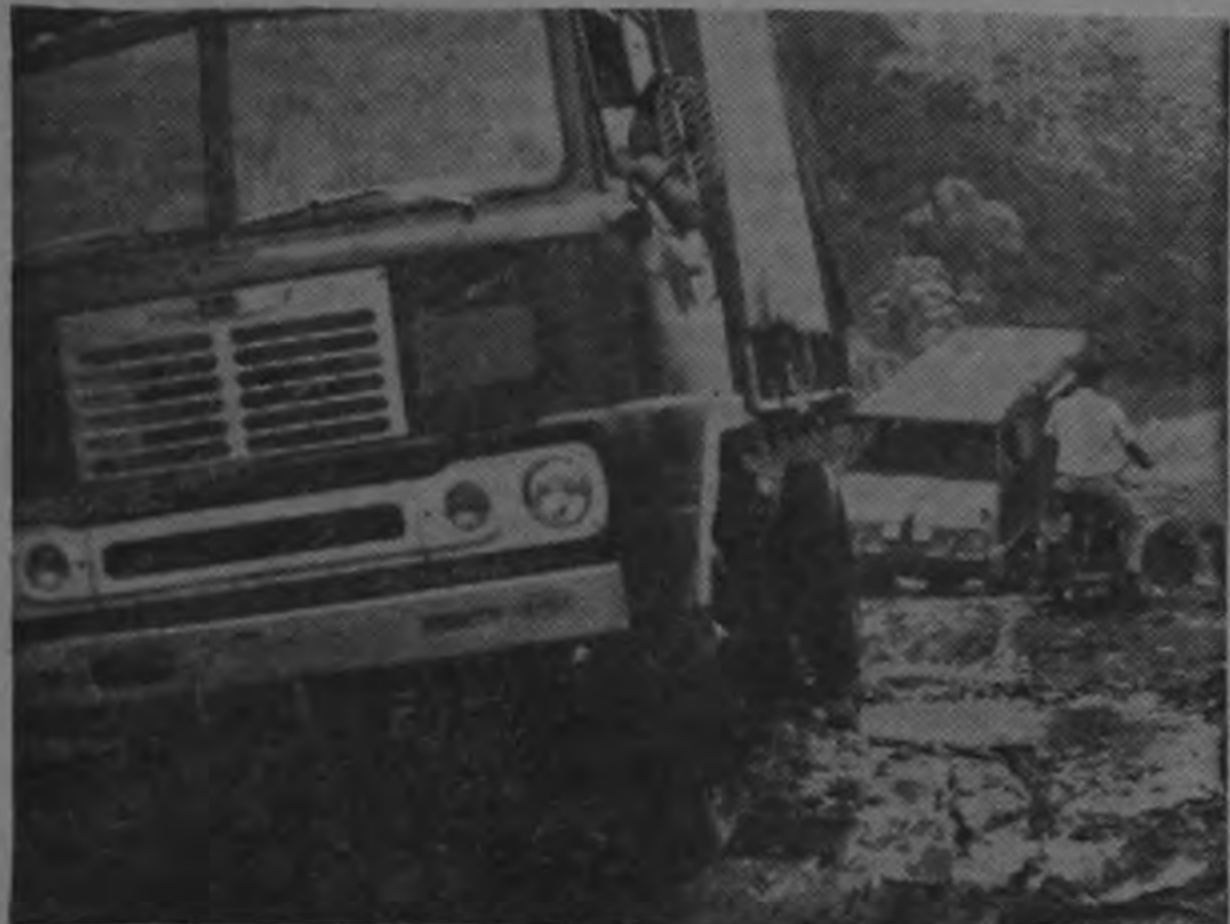
Este es uno de los muchos vados que se han formado por las inundaciones del año anterior. Los vehículos se ven forzados a ocupar doble tracción para cruzarlos.

tancia de cuarenta kilómetros tardan hasta seis horas y media y en muchos casos no llegan a su destino porque se atascan.