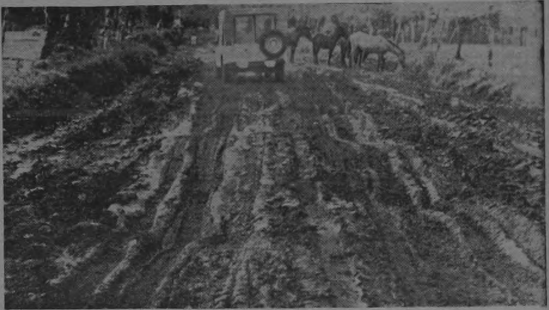
Esta es una de las mejores carreteras por donde se transporta el banana en Pococí, donde los camiones para recorrer una dis-

aguas. Dentro de los planes del Ministerio de Transportes está trasladarlo a otro sector donde tenga la utilidad necesaria.