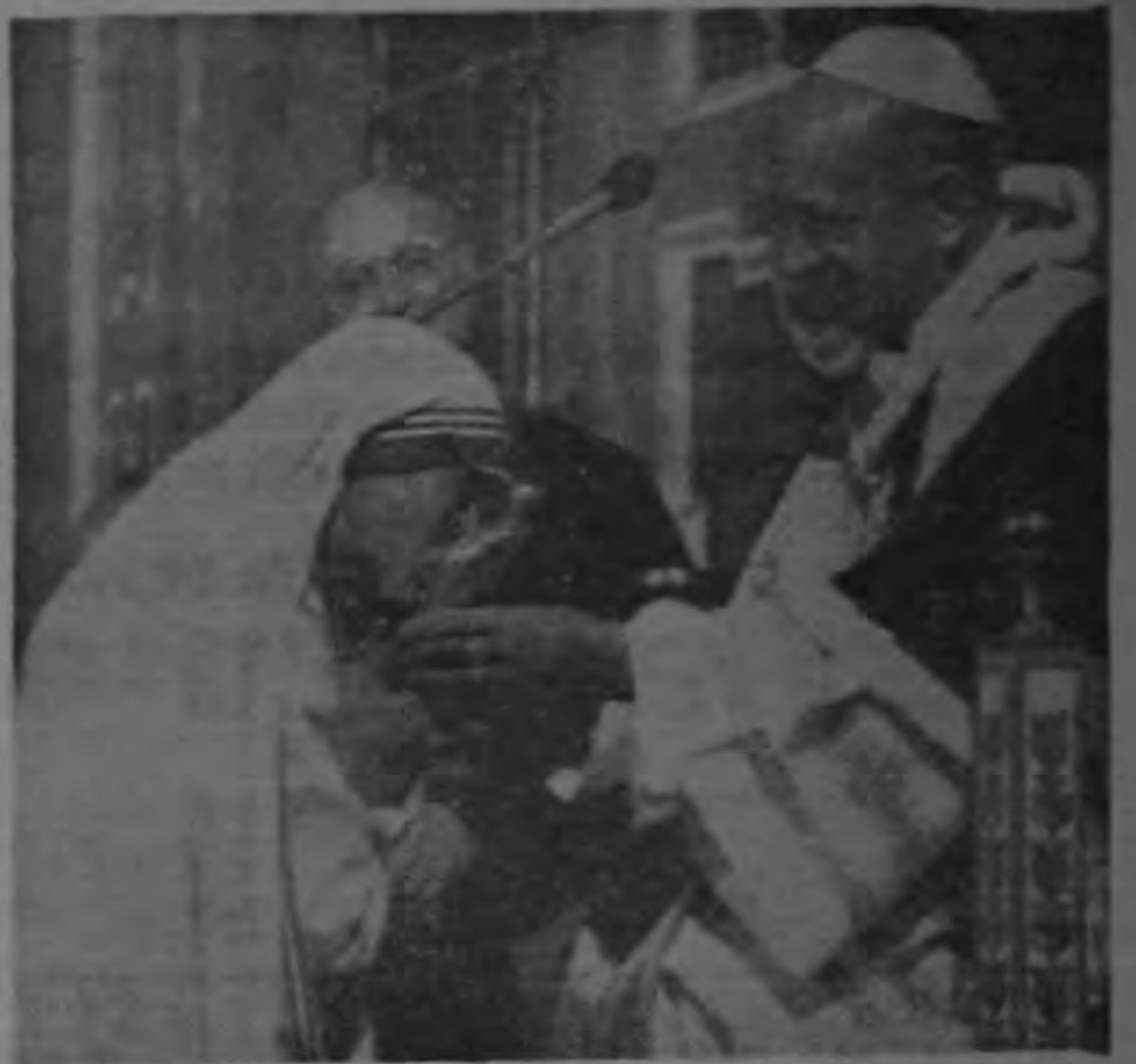
Su Santidad el Papa Paulo VI, bendice a la Madre Teresa, fundadora de las Misioneras de la Caridad. Besa una estatua de Jesús que le entregó el Sumo Pontífice.