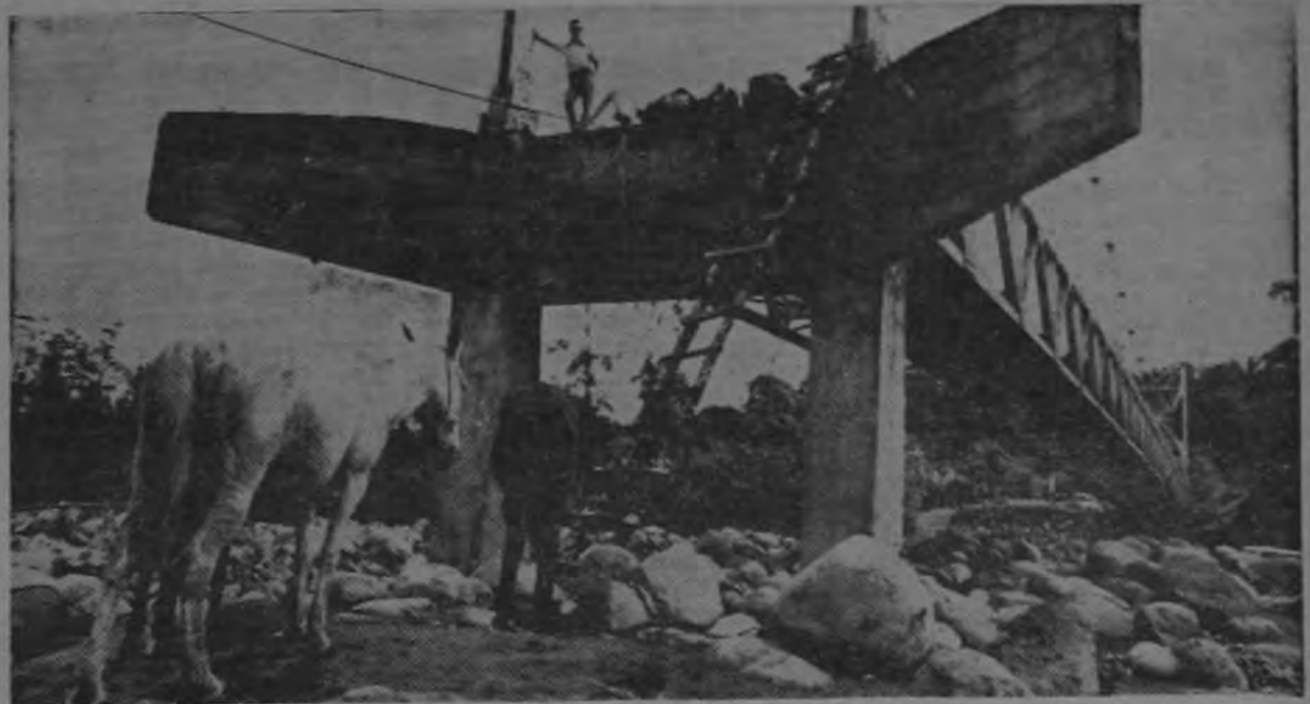
El puente sobre el Río Toro Amarillo, construido hace seis años para habilitar la zona de Pococí, ahora está totalmente abandonado y a punto de ser arrasado por las

Por otro lado, ayer en Guápiles, se ordenó darles prioridad a trabajos en las vías de transporte de banana, o sea las de Vado de Tortuguero a Pueblo Nuevo, Leesville y Roxana, y acto seguido la ruta autobusera entre Guápiles y Pueblo Nuevo.